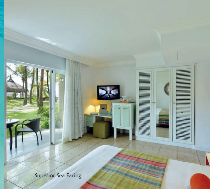
Superior Sea Facing