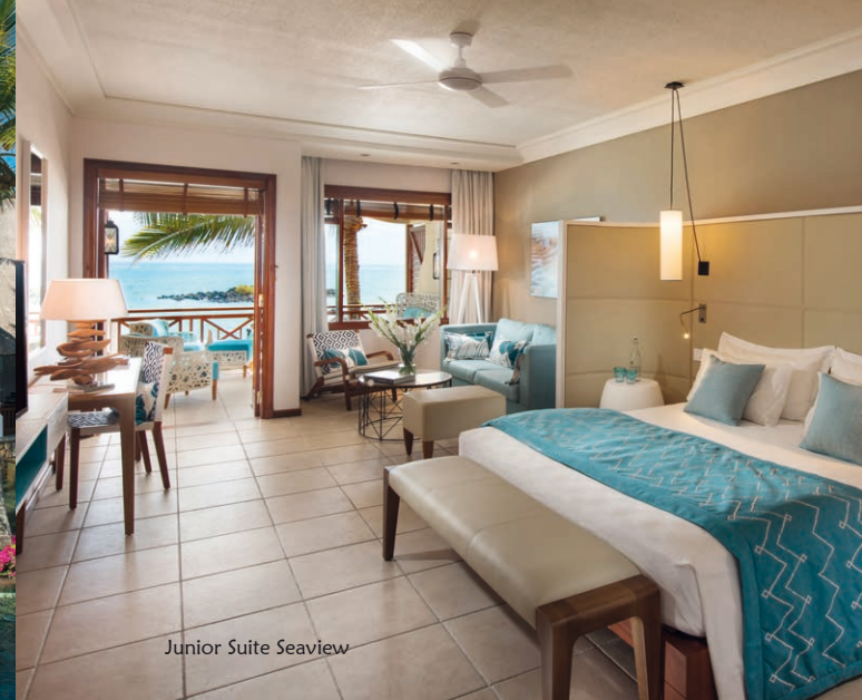
Junior Suite Seaview