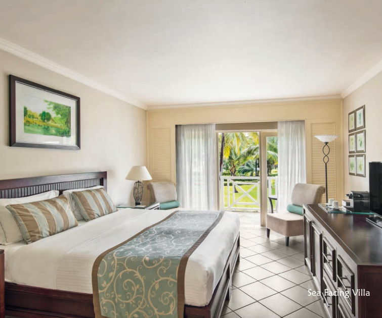
Sea Facing Villa