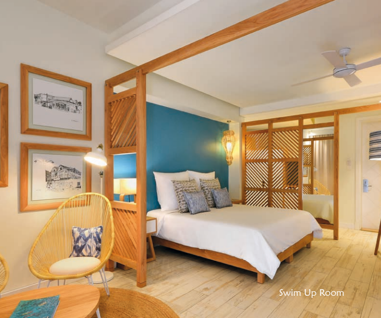
Swim Up Room