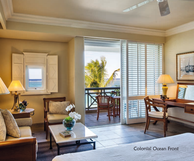
Colonial Ocean Front