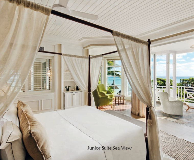
Junior Suite Sea View